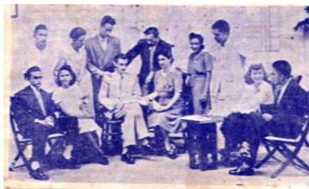
Leitura da peça de Mário Couto “Toque a Serenata de Schubert” estreada a pouco com os elementos que se vêem na gravura.

recorrente entre rapazes e moças da primeira juventude.