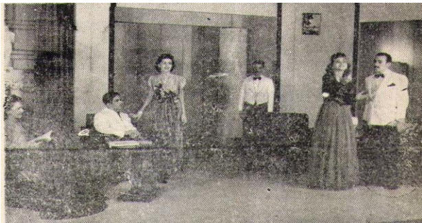
Cena da peça Não te conheço mais , a primeira levada pelo Teatro do Estudante do Pará 3 .