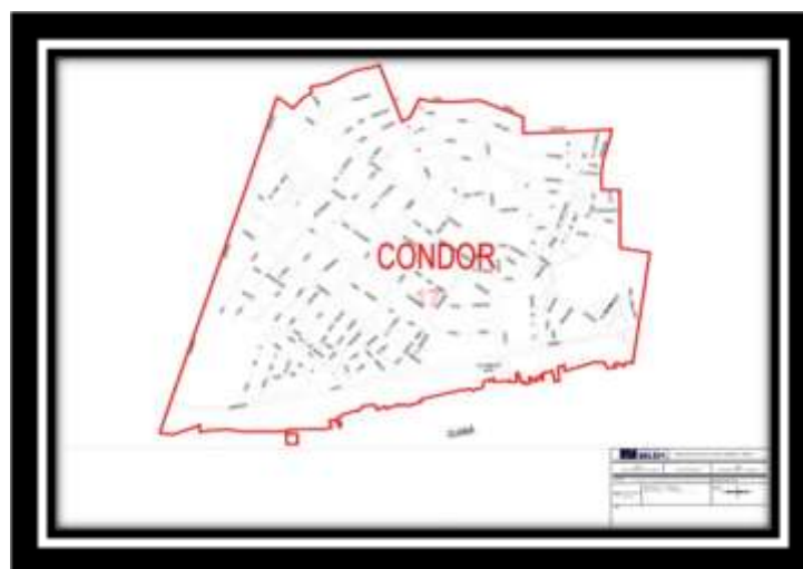
Imagem 01 – Mapa de Belém (PA): Limites do bairro da Condor.