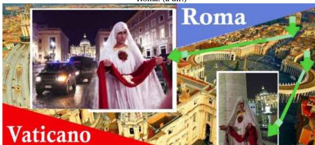
Imagem 4 - Flores Para Pietá reperformada na praça do Vaticano (à esq.) e na Via Della Conziliazione - Roma. (à dir.)

Fonte: Ester Leray. Montagem do autor (2018)