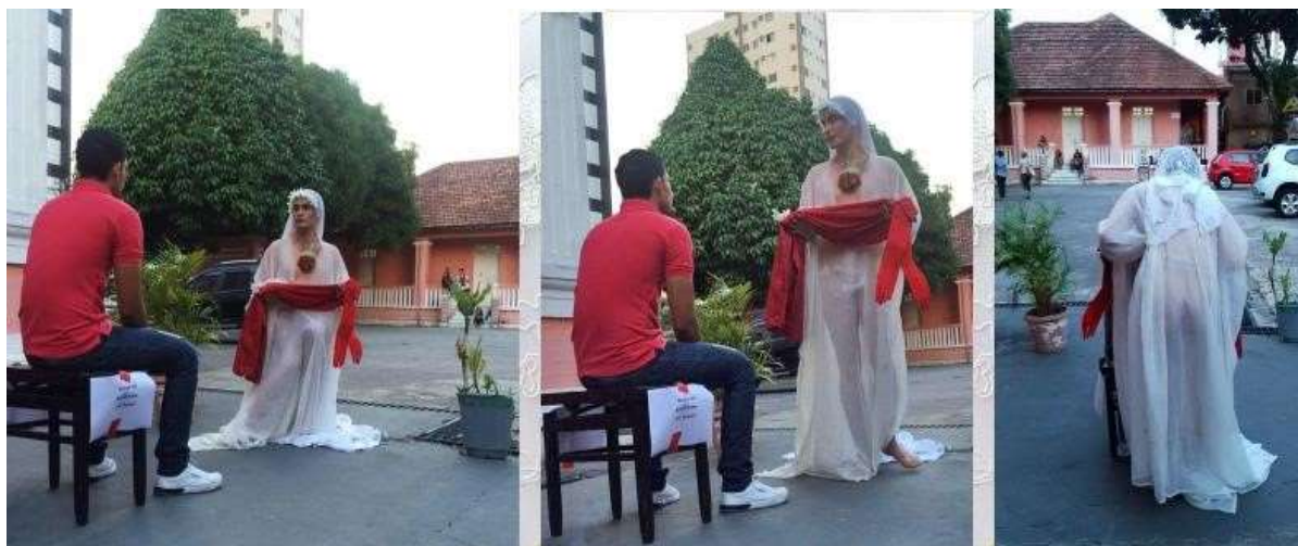
Imagem 1- Primeira ação performática de Flores para Pietá

Os afetos disparados entre os participantes e o performer com a visualidade da Virgem de Pietá são múltiplos e seus efeitos os mais diversos. Alguns participantes choraram, outros sorriram envergonhados, uma grande parcela ficou emocionado, alguns levaram a mão ao peito, alguns (escassamente) debocharam, a grande maioria respirava de forma ofegante, outros estavam visivelmente relaxados e confortáveis no processo; alguns permaneceram inquietos e volúveis (ANDRADE, 2019, p. 58).