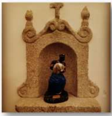
Foto 1 – Imagem de Ogum, Casa-Museu Abel Salazar, Instalação Incorporação