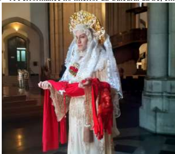
Imagem 5 - A Performance no interior da Catedral da Sé, em São Paulo

Não tardou cinco minutos para a segurança vir até o seu encontro e solicitar que o mesmo saísse, no qual o performista indaga sobre qual o motivo da expulsão, haja vista que não estava fazendo nada demais. O guarda, sem hesitar e nem procurar um tom eufemístico para disfarçar a coerção, diz: “Você não pode estar assim, neste lugar”. No qual o performer afere: “Por qual motivo?”, o segurança delimitou-se, então, em retrucar: “Estou solicitando que saia. Você não está autorizado!”.