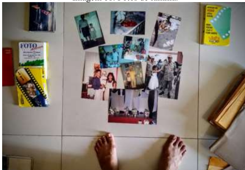
Imagem 01: Fotos de família.