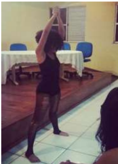
Imagem 03: Performance A Carne mais barata do mercado.