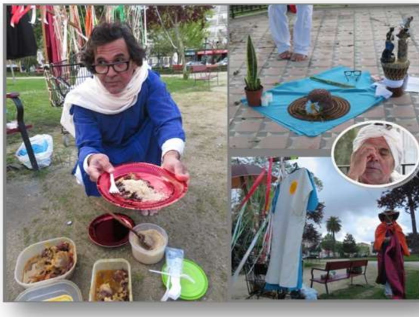
Foto 6: Interferência Poesófica Sete Espadas para Ogum (Praça da República/Praça do Marquês)