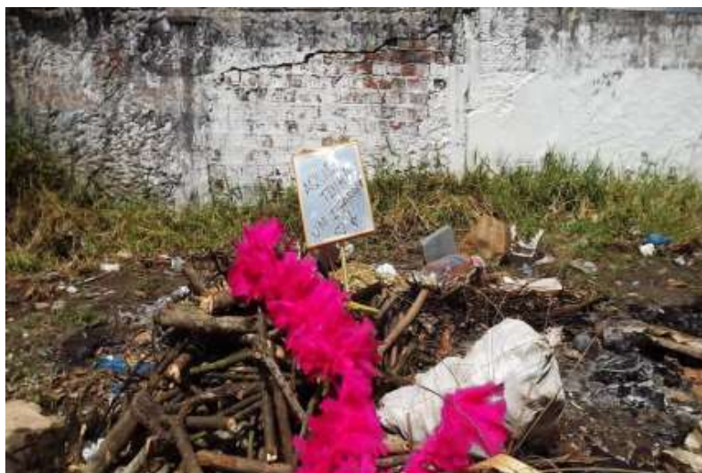
Elma Totty (2015)

Corpografia 03: “Aqui tinha um igarapé!” Performance a São Marçal- Proibido para o banho. Icoaraci-PA.