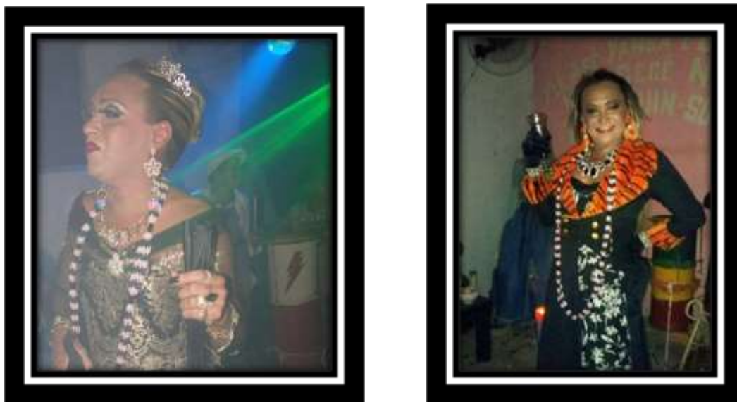
Imagens 02 e 03 – O Baile da Dona Maria Padilha no ano 2014 e 2015, respectivamente.

o espaço entre a cama e a penteadeira (composta de várias maquiagens, perfumes franceses e colônias regionais) e também havia uma geladeira branca, um guarda-roupa e um pequeno bar de madeira de lei com algumas garrafas de whisky chivas , tudo isso para receber a Rainha das Encruzilhadas.