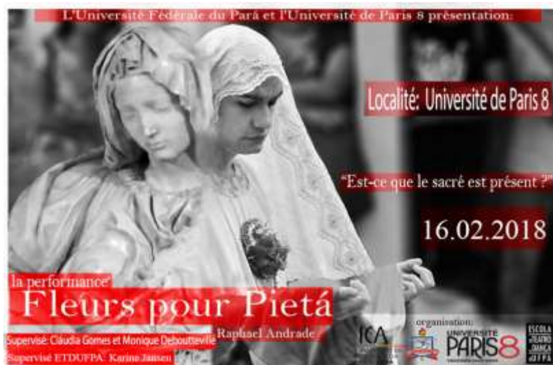
Imagem 2- Imagem do cartaz referente à apresentação da performance na Université Paris VIII-Vincennes em Saint Denis .