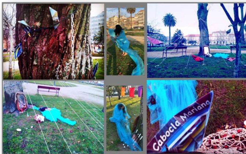
FOTO 8 - Interferência Poesófica Yemanjá Asé Esú!, Praça da República