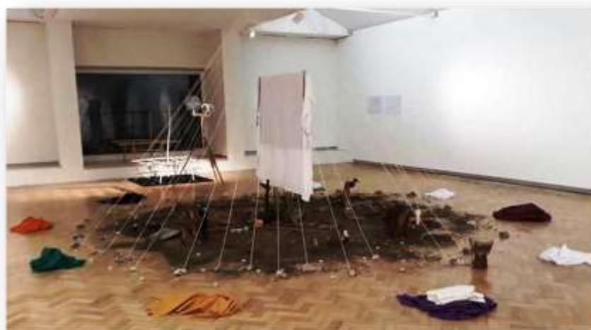
Foto 3 - Pirâmide de fios, Galeria OMuseu, Instalação Contemplação