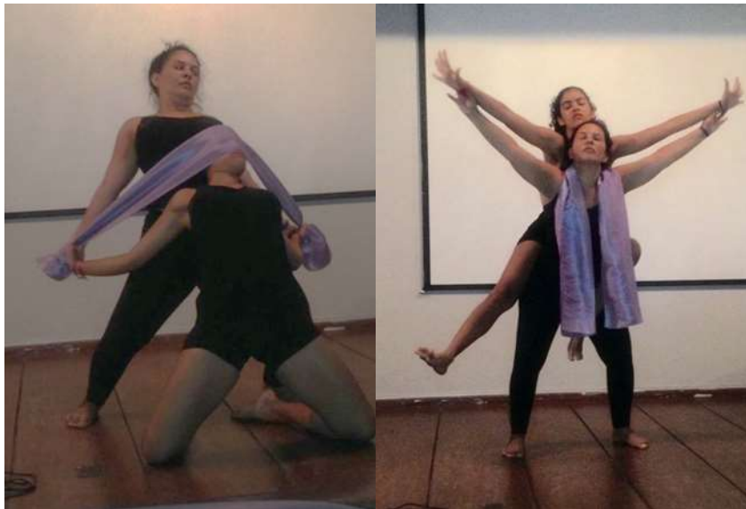
Imagem 04: Performance Mala de Ossos

A Educação Física trata [...] do conhecimento de uma área chamada de cultura corporal. Ela é constituída com temas ou formas de atividade, particularmente corporais [...] visa aprender a expressão corporal como linguagem (COLETIVO DE AUTORES, 1992, p. 41).