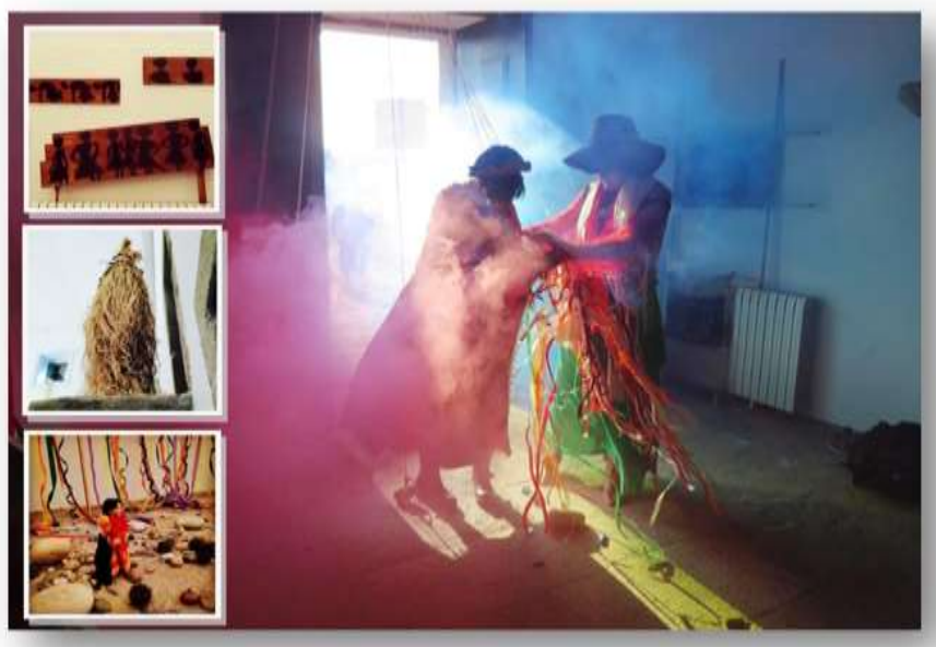
Foto 4 – Performances e objetos, Casa-Museu Abel Salazar, Instalação Incorporação