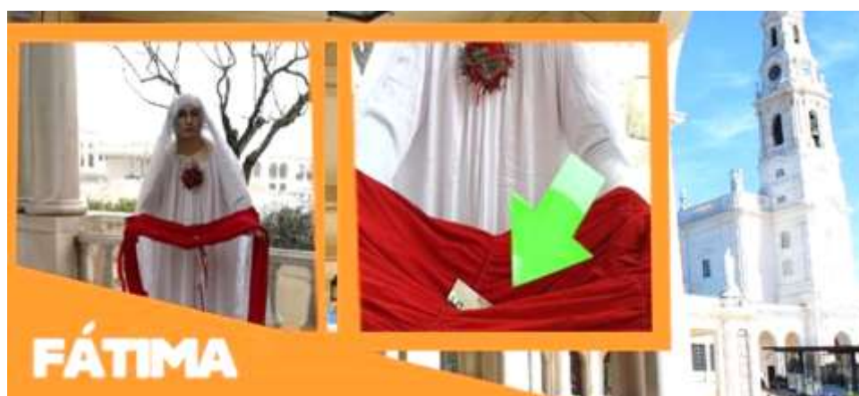
Imagem 3- Performance Flores para Pietá apresentada na praça do santuário de Fátima (Portugal). A seta aponta o dinheiro doado pelos transeuntes