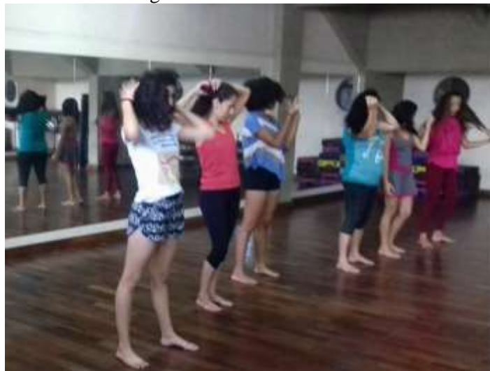
Imagem 02: O soltar dos cabelos