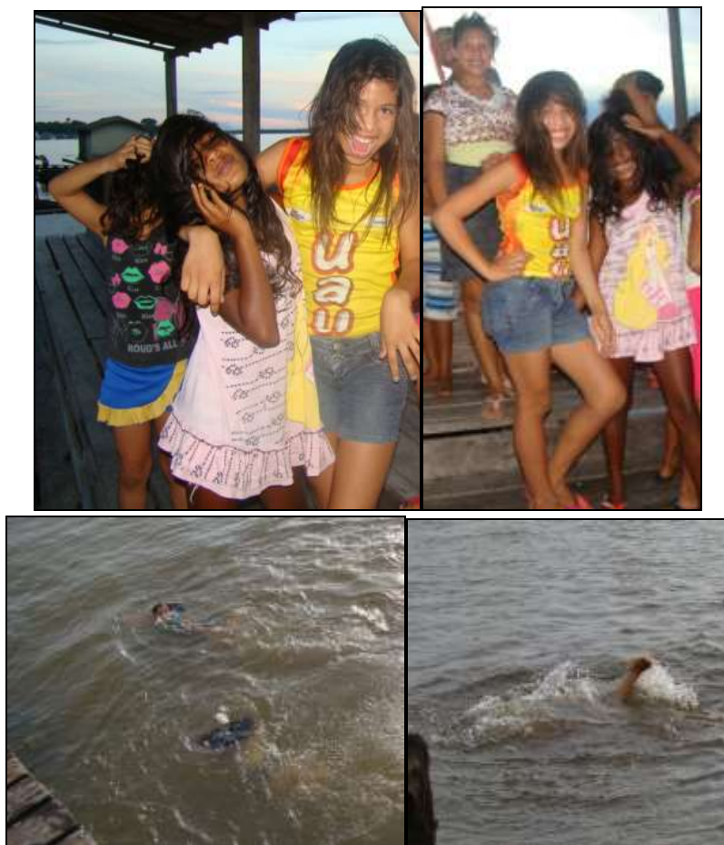
Imagem 1 - As meninas-sereias do Piriá.