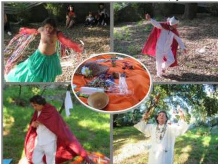
FOTO 7- Interferência Poesófica Arara-Encantadeira, Quinta do Covelo