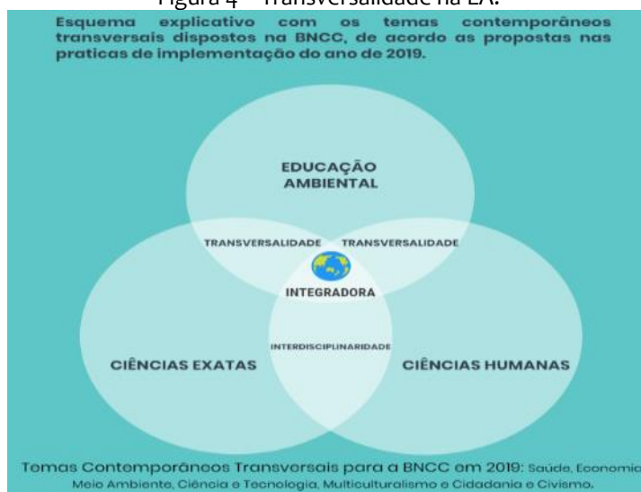
Figura 4 – Transversalidade na EA.