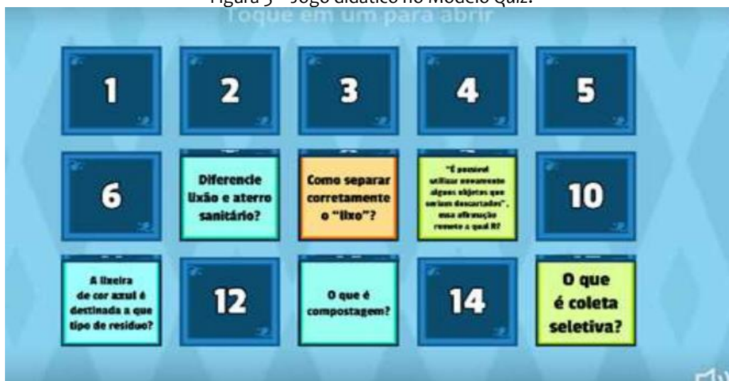
Figura 3 – Jogo didático no Modelo Quiz.