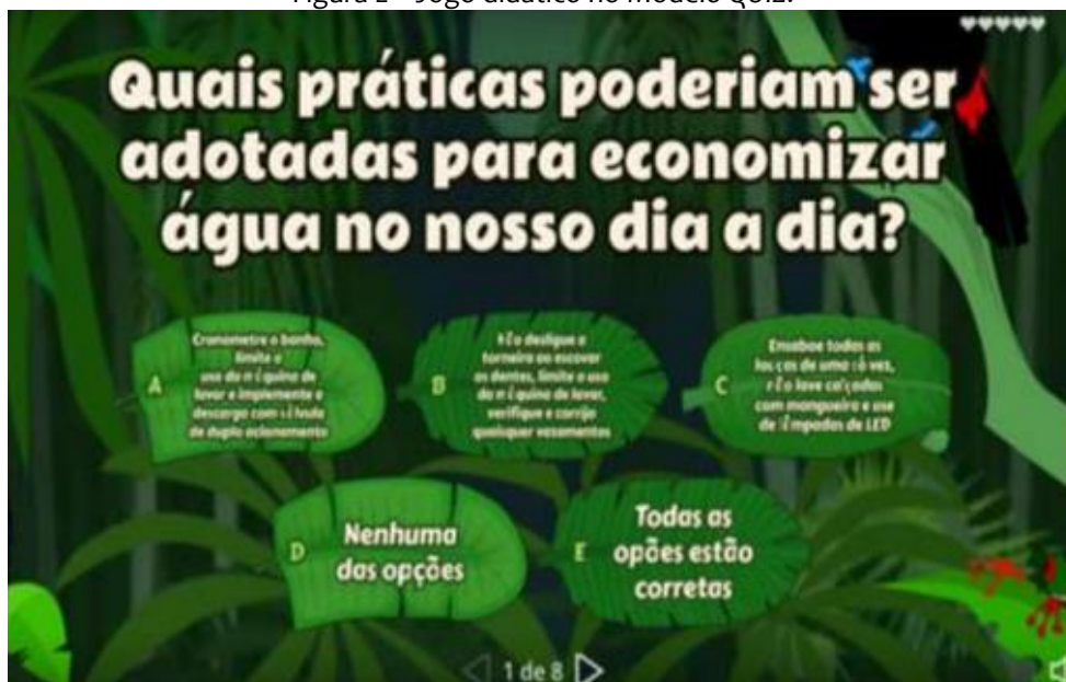
Figura 2 – Jogo didático no Modelo QUIZ.

Fonte: Menezes, Carvalho e Martins, 2022.