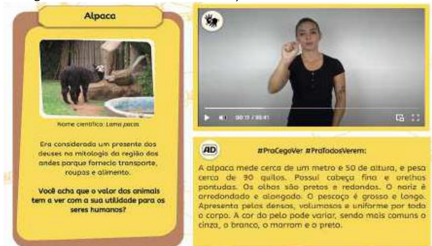
Figura 1 – Ferramenta online de educação ambiental com acessibilidade

O primeiro estudo selecionado se intitula Ferramenta online de educação ambiental com acessibilidade em tempos de isolamento social , de Santos et al. (2020), que apresenta um material digital voltado para o período de isolamento social, causado pela pandemia de covid-19. A Figura 1 ilustra a interface da ferramenta, que possui uma descrição textual do animal na parte lateral esquerda. À direita, o usuário encontra a tradução em Libras (vídeo), assim como algumas outras características de cada animal.