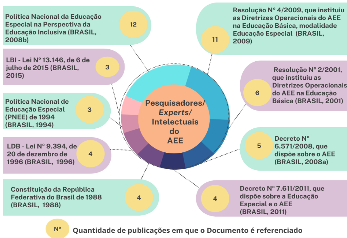
Figura 3 - Principais documentos citados ao referenciar o AEE

Quanto às fontes documentais mais utilizadas identificadas, notamos a predominância dos documentos nacionais oficiais (leis, decretos, resoluções) apresentados na Figura 3.