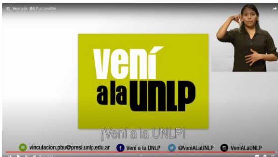
Imagen 5: Captura de pantalla de la presentación del video institucional “Vení a la UNLP” con intérprete de lengua de señas y subtulado. / Imagen 6: Proyección del video institucional “Vení a la UNLP” con intérprete de LSA-E