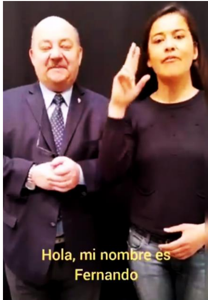
Imagen 13: Asesor sordo dando indicaciones.