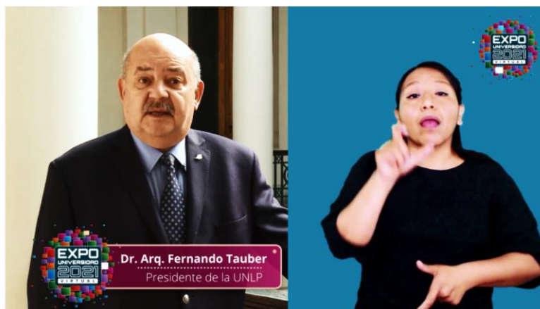
Imagen 18: Captura de pantalla del saludo de bienvenida virtual del Presidente a la UNLP. La accesibilidad para esta presentación se elaboró de manera conjunta entre la Dirección de Inclusión, Discapacidad y DDHH y el Centro de Producción Multimedial de la UNLP. Saludo del Sr. Presidente de la UNLP con ILSA-E