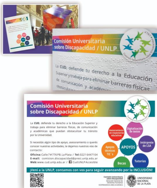
Imagen 4: Folleto institucional en formato accesible (QR con contenido en audio)