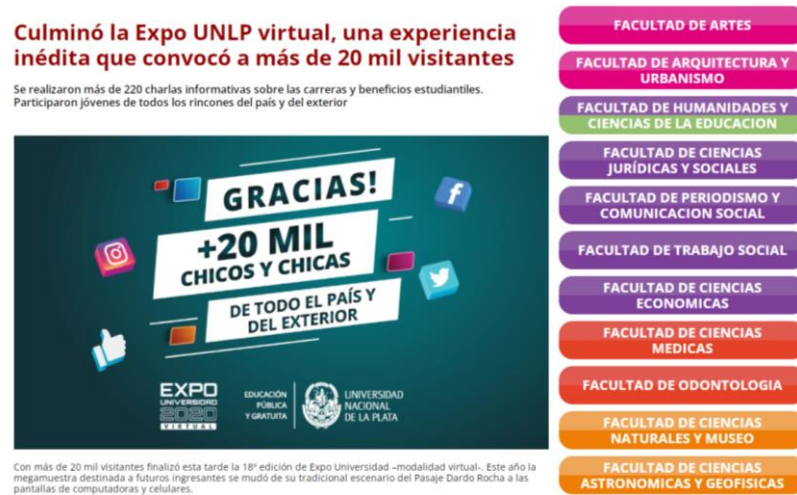
Imagen 16: Captura de pantalla de la publicación de cierre de la Expo, una experiencia inédita que convocó a 20 mil visitantes.