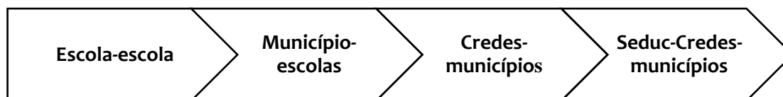
Figura 2: Níveis de monitoramento do trabalho pedagógico dos professores