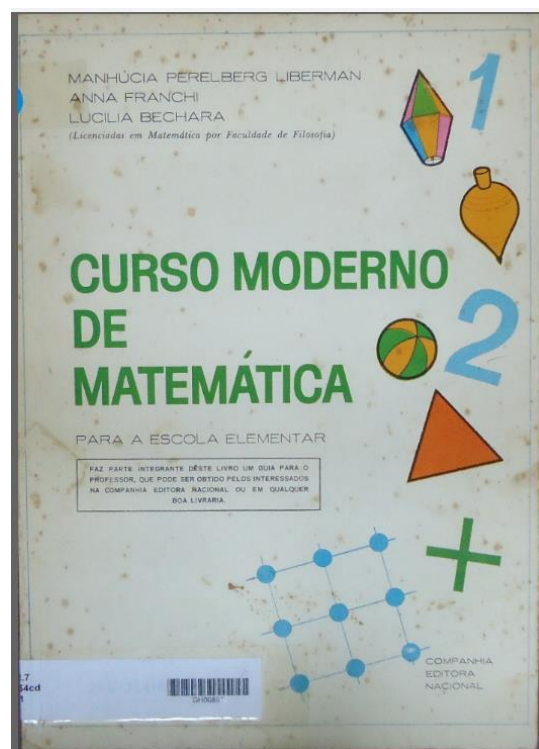
Figura 1: Capa do livro Curso Moderno de Matemática