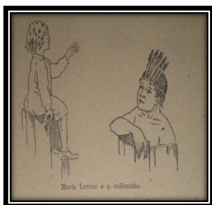
Imagem 5 – Maria Leonor e o índio da Tribo Tupi

No Quadro 2 e nas Imagens 5 e 6, que vêm a seguir, verificamos que a menina está em uma posição de superioridade em relação ao índio e os portugueses mantinham relação amistosa com os povos que aqui viviam, cabendo ao nativo a obediência ao branco europeu.