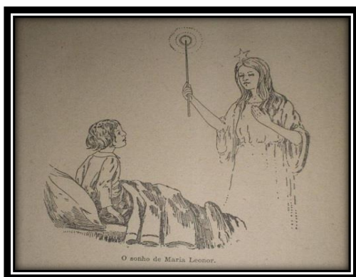
Imagem 3 – A fada Brasiléia e a menina Leonora