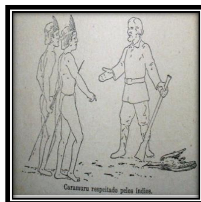
Imagem 6 – Diogo Álvares Correia, o Caramuru

A menina que ordena a presença do índio (Psiu! Indiozinha! venha cá!, p. 15) e o europeu que engana os indígenas, assim como a posição da Princesa Isabel como protagonista da abolição, são meios de disseminar a superioridade dos brancos em